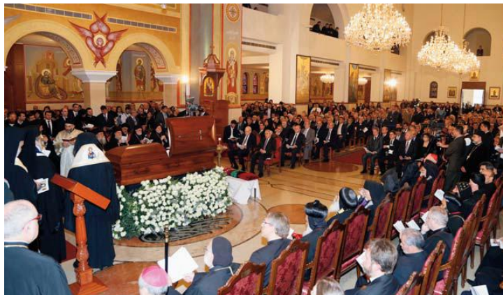
patriarches et représentants des Eglises orthodoxes et des Eglises sœurs dont le cardinal Poupard représentant du pape Benoit XVI