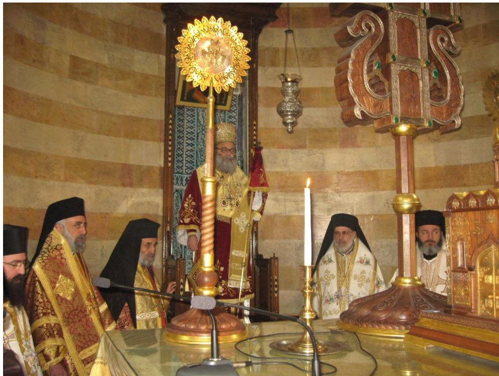
Au trône de la cathédrale du siège patriarcal à Damas - Liturgie du 1er jour de l'an