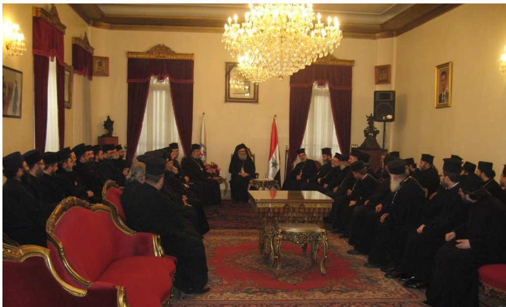
première rencontre avec les prêtres du diocèse de Damas dans les salons du siège du Patriarcat