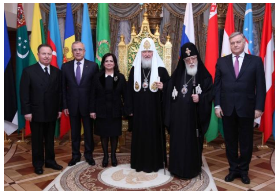
Le président et son épouse avec le patriarche de Moscou et le patriarche de Géorgie qui était également à Moscou