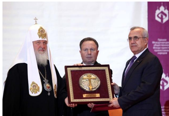
Remise du prix au président libanais