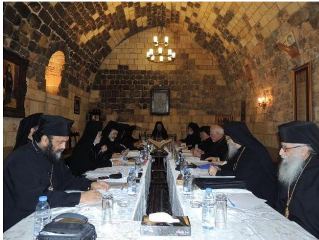
Réunion du Saint-Synode à Balamand, le 17 décembre 2012

Jean X, de l'élection à Balamand à l'entrée à Damas ! Ispola et !