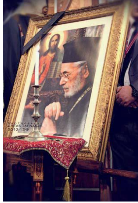
Mémoire éternelle Ignace IV