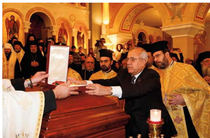
Le président de la République libanaise remettant les insignes de la plus haute distinction du pays du Cèdre, remise posthume au patriarche défunt