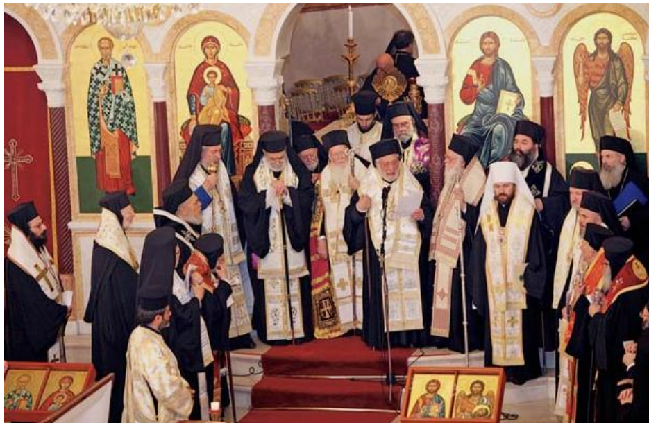
Obsèques à Beyrouth - Les évêques d'Antioche entourent le patriarche œcuménique Bartholomée 1er