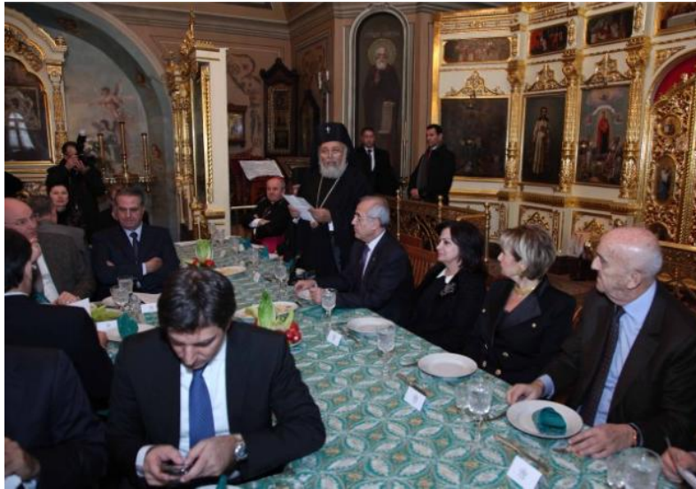
au métouchion du Patriarcat grec-orthodoxe d'Antioche à Moscou