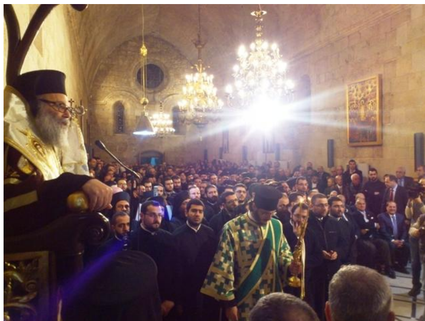
Le patriarche Jean X au trône de l'église du monastère Notre-Dame de BALAMAND