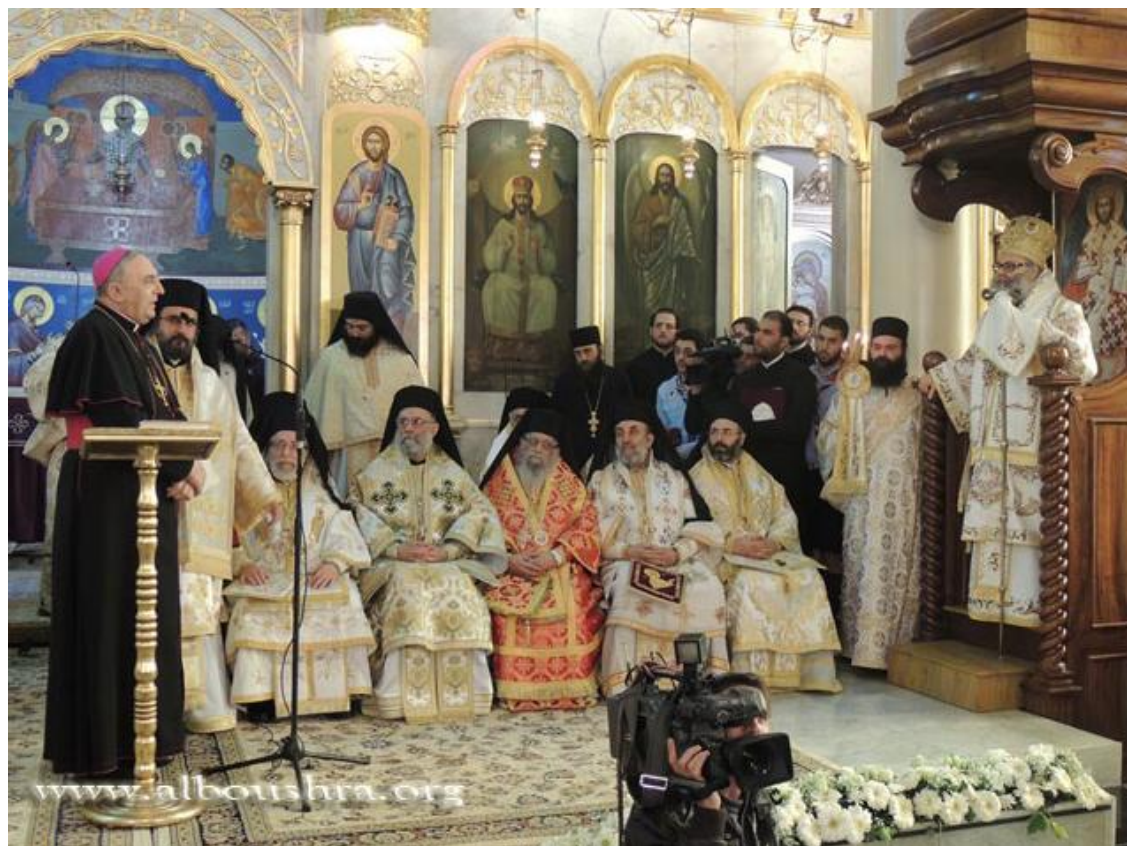
Allocution du nonce apostolique à Damas de la part du pape Benoit XVI