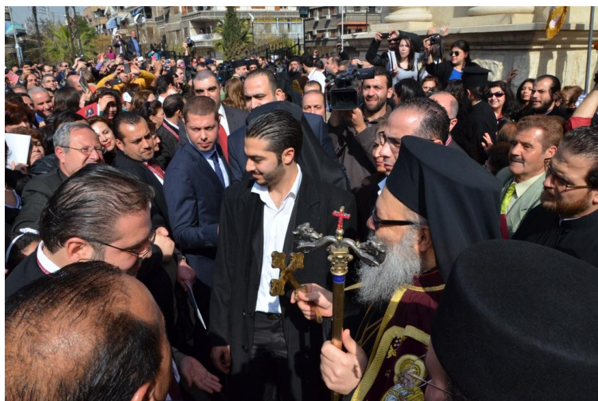
Le patriarche Jean X au milieu de son peuple, l'Eglise !